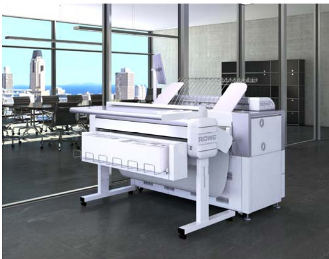
Abb.1: Die VarioFold Compact Online ist mit jedem marktüblichen Großformatdrucker kompatibel.